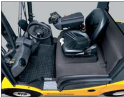
Bequemer und leistungsfördernder Arbeitsplatz